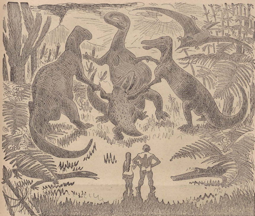
„Das muß alles, alles anders werden!“