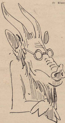
(ff. Bl. 14)

Ich bückte mich, und plötzlich sah ich das Bild der sprungheligen Leopardin. Es lag zwischen dem Kuverts, Kartons und Briefbögen. Ich hob es auf und ließ die Mappe mit ihrem herausgequollen Inhalt liegen. Ich legte es auf einen Schreibtisch. Meine Hand zitterte nicht. Auch nicht, als ich dann die eigene Brieftasche hervornahm und das kleine Geheimfach öffnete. Das Bild war da,