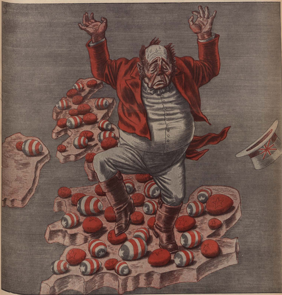
La danza delle uova pasquali di John Bull